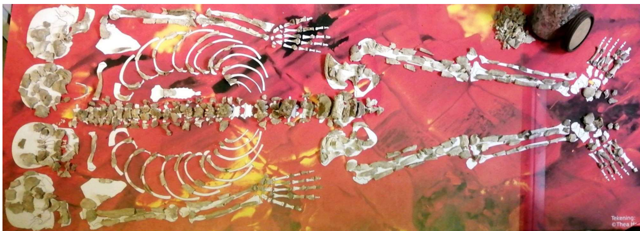
Een detail uit de archeologie expositie

Deelcollectie 9 is slechts een welkome aanvulling om het museum interessant en aantrekkelijk te maken.