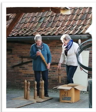
De educatie groep volop bezig

Het is de bedoeling dat kinderen op allerlei manieren bij de activiteiten en exposities in het museum betrokken worden.