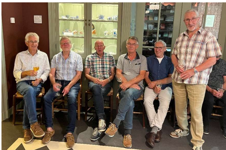
Een aantal enthousiaste vrijwilligers

Naast het vijf leden tellende bestuur en de vier vaste medewerkers beschikt het museum al jaren over een groot aantal vrijwilligers. Eind december 2022 telde het museum 60 vrijwilligers om alle noodzakelijke werkzaamheden te verrichten.