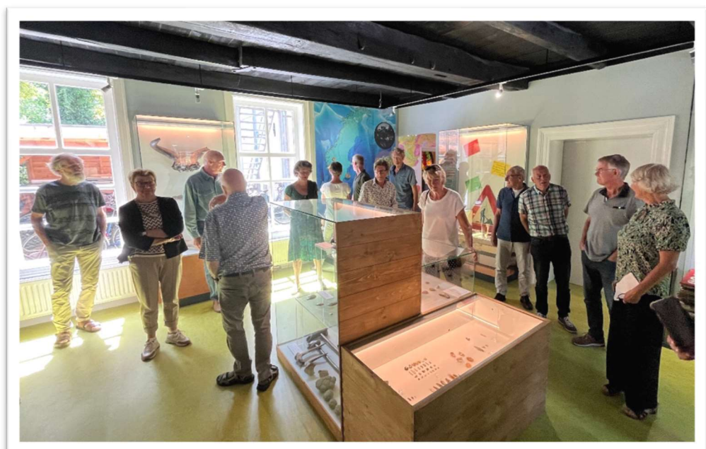
Een indruk van de afdeling prehistorische archeologie

Als sluitstuk van de herinrichting is op de eerste verdieping de geschiedenis van de Nieuwe Tijd tot in de vorige eeuw aan de beurt. We behandelen hier drie thema's: mode, ondernemingen en het dagelijks leven. We gebruiken voor dat laatste thema de inbreng van leerlingen van de Hogeschool Arnhem-Nijmegen, die ons weer fris naar onze collectie lieten kijken. We vertrouwen erop dat we dit langjarige project in 2024 kunnen afsluiten met een feestelijke opening.